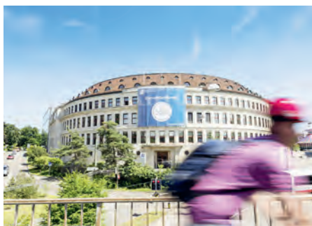
Campus St.-Georgen-Platz Volkart-Gebäude in Winterthur, School of Management and Law.

Die UN-Initiative „Principles for Responsible Management Education“ setzt sich für eine verantwortungsvolle Managementausbildung und die Erreichung der Sustainable Development Goals ein.