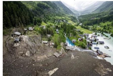
2025, Naturkatastrophe Blatten (CH)