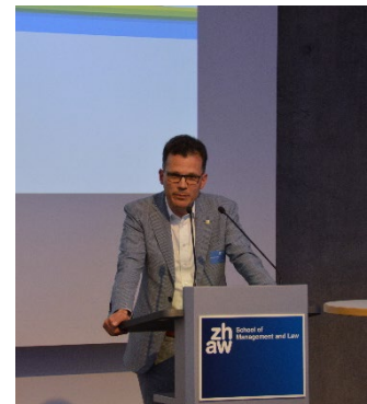
Dominik Diezi erläutert die Thematik aus politischer Perspektive

Dr. iur. Dominik Diezi, Regierungsrat des Kantons Thurgau und verantwortlich für das Departement für Bau und Umwelt, gewährte einen Einblick in die Praxis der kantonalen Denkmalpflege. Er erläuterte die aktuellen Herausforderungen des Kantons Thurgau. Die fehlende Akzeptanz der Denkmalpflege durch verschiedene Anspruchsgruppen stellt laut Diezi ein zentrales Problem dar. Um die Akzeptanz zu steigern, plant der Kanton Thurgau nun ein Massnahmenpaket, das die Fokussierung auf das tatsächlich Schützenswerte zum Ziel hat. Dazu soll eine Fachgruppe entsprechende Objekte identifizieren. Anschliessend sollen anstelle eines umfassenden Schutzplans Einzelschutzverfügungen und ein IDEGO (Inventar der erhaltenswerten und geschützten Objekte) eingeführt werden. Diese Massnahmen sollen für mehr Rechtssicherheit sorgen, die Anzahl der Streitfälle reduzieren und die Akzeptanz der Denkmalpflege erhöhen.