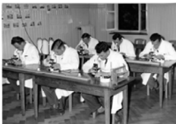
1_Labor-Unterricht an der damaligen Schweizerischen Obst- und Weinfachschule (SOW) in den 50er Jahren