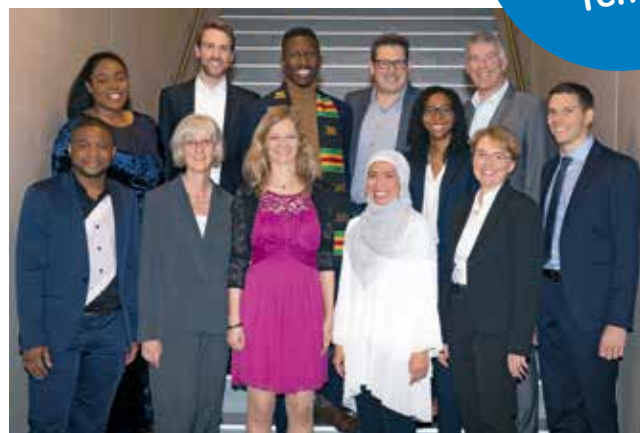
MSc in FM Absolvierende März 2019

Herzliche Gratulation an alle Absolvierende