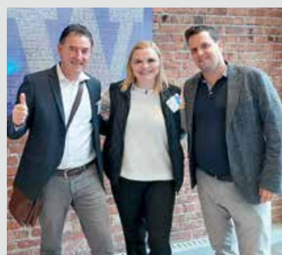
Teilnehmende an der COIL-Coaches 2019