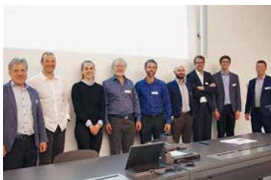
Referierende der Tagung «Energieeffiziente Facility Services und Gebäudeerhaltung» 2019