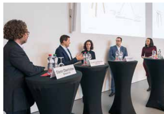
Teilnehmende und Referierende am IFM Day 2019