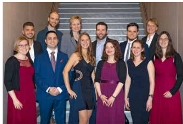
BSc in FM Absolvierende (Teilzeitstudiengang) März 2019