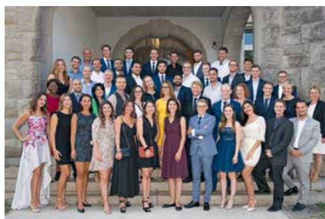
BSc in FM Absolvierende August 2019