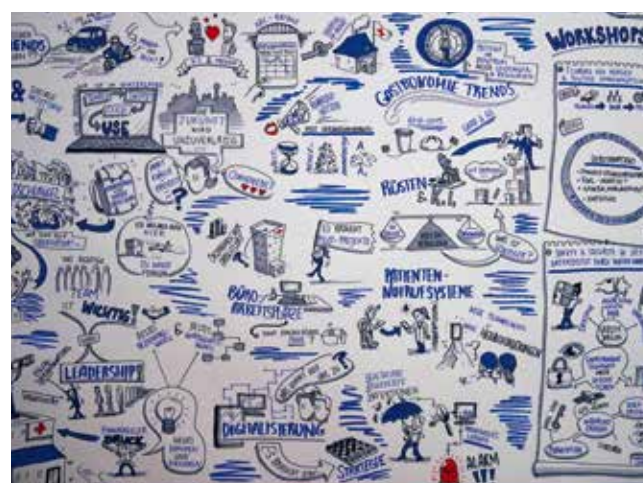
FM Innovation in HC digital