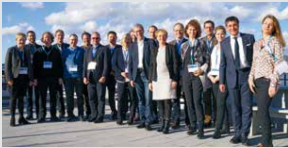
Die GEFMA Professoren zu Besuch in Wädenswil

Seine Zusammenarbeit mit der Schweizer und internationalen FM- und Immobilienwirtschaft in Lehre und Forschung förderte das IFM mit dem grossen Branchentreffen: Spitzenleute der Verbände Allpura, EuroFM, fmp, IFMA Schweiz, RICS und SVIT FM sowie Professorinnen und Professoren des Deutschen Verbandes für Facility Management GEFMA unterstützten den vom IFM initiierten Leaders Round Table im Wädenswiler Schloss Au.