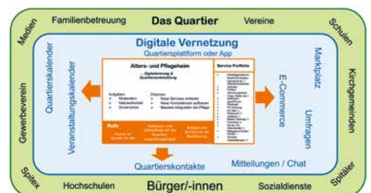
Umfeld der neuen Positionierung

Für weitere Projekte und mehr zu unseren Kompetenzgruppen besuchen Sie: