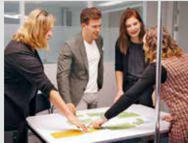
Engagierte Studierende entwickeln zusammen Visionen für künftige Lernumgebungen