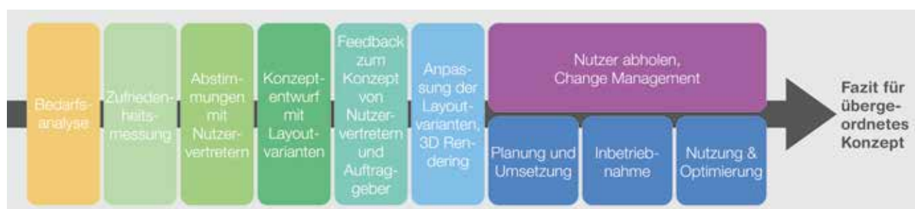
Entwicklung eines strategischen Arbeitsplatzkonzeptes

medizinischen Personals an die Arbeitsumgebung für patientenferne Tätigkeiten umfassend zu verstehen. So wurden räumliche und tätigkeitsspezifische Bedürfnisse erfasst und auf dieser Basis ein massgeschneidertes Konzept entwickelt und umgesetzt, welches sowohl die flexible Arbeitsweise des medizinischen Personals unterstützt wie auch die übergeordneten Anforderungen des USZ erfüllt.