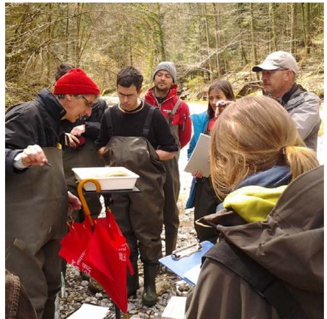
Die Teilnehmer des CAS-Weiterbildung Makrozoobenthos während einer Probennahme

Makrozoobenthos oder Makroinvertebraten nennt man die Gesamtheit aller, von Auge erkennbaren (makro) wirbellosen Tiere (zoo), die den Gewässergrund (benthal) besiedeln. Diese Lebensgemeinschaft besteht aus Steinfliegen, Köcherfliegen, Eintagsfliegen, Libellen, Käfer, Schnecken, Muscheln, Kurstentiere und weitere Organismengruppen. Die Zusammensetzung dieser Lebensgemeinschaft unterscheidet sich je nach Wasserqualität und Morphologie des Gewässers. Deshalb ist es möglich, durch Untersuchungen des Makrozoobenthos Aussagen über den Zustand eines Gewässers zu machen.