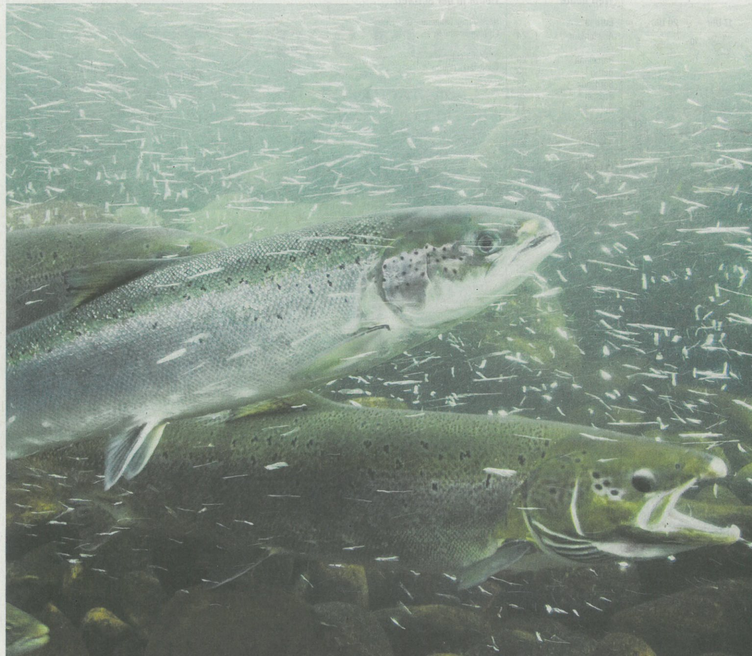
Wildlachse kehren für die Zeit der Eiablage in den Fluss zurück.