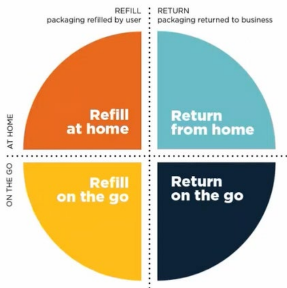
Abbildung 1: Die vier REUSE Modelle (Lendal & Wingstrand, 2019)

Mehrwegsysteme können in verschiedene Modelle der Wiederverwendung unterteilt werden. Nach der Systematik der Ellen MacArthur Foundation lassen sich vier grundlegende REUSE-Modelle unterscheiden: Refill-at-home und Refill-on-the-go-Systeme, bei denen Konsumenten Verpackungen selbst wieder befüllen, sowie Return-on-the-go- und Return-from-home-Systeme, bei denen Verpackungen an Sammelstellen zurückgegeben oder beim Konsumenten abgeholt werden (Abbildung 1) (Lendal & Wingstrand, 2019).