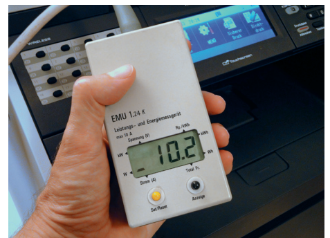
Verbrauchsmessung vor Ort an einem Kombigerät.