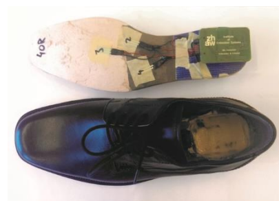
Übersicht über das fertige Produkt. Oben ist die Sohle mit den eingebauten Sensoren und der Leiterplatte sichtbar, unten der Schuh mit der in der Ferse eingearbeiteten Vertiefung.