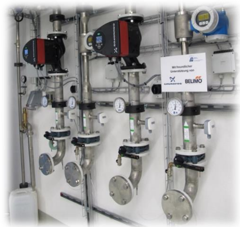
Hydraulikanschluss zur Einbindung von Kundenanlagen

Mit dem Hydraulikanschluss im Kälteprüfstand des IEFE lassen sich Kältemaschinen und Wärmepumpen unter vielfältigen Betriebsbedingungen testen. Der flexible Aufbau des Prüfstandes garantiert dabei eine grosse Spannweite an möglichen Randbedingungen. Die Labormessung bietet dadurch die Möglichkeit, die Maschine vor der Auslieferung zu prüfen. Die Instrumentierung des Hydraulikanschlusses ermöglicht eine Live-Überwachung der vollständig instrumentierten Sekundärseite. Prozessgrössen des Kältemittelkreises können ebenfalls überwacht, aufgezeichnet und mittels dynamisch aktualisiertem log p-h-Diagramm auf dem Bildschirm der Laborcomputer online visualisiert werden. Die Prozessgrössen des Kältemittelkreises können per Modbus-Schnittstelle von der Maschinensteuerung bezogen werden. Ist eine weitere Instrumentierung erwünscht, können zusätzlich applizierte Sensoren die gewünschten Messdaten erfassen. Durch die Instrumentierung des Kältemittelkreises lassen sich Betriebszustände genau analysieren um ggf. Optimierungen an der Maschinensteuerung vorzunehmen.