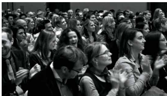
Applaus für die neuen Bachelors in Kommunikation