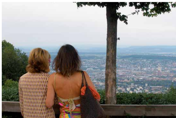
Der Ausblick vom Uto Kulm über die Stadt Zürich braucht keine Übersetzung.