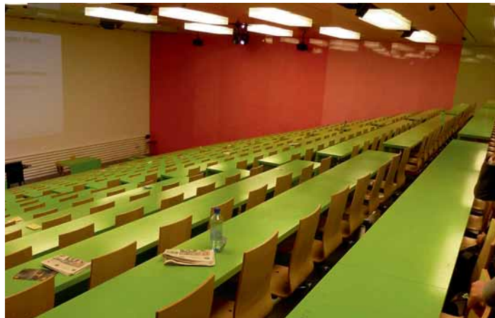
Beeindruckende Farbgestaltung im Hörsaal von Gigon/Guyer

Der Betriebsdienst Zentrum ist für die Gebäude im Zentrum, im Botanischen Garten, in der Hochschulsportanlage Fluntern und im Betrieb Nord zuständig. Organisatorisch ist der Betriebsdienst unterteilt in den Veranstaltungsdienst, die Instandhaltung/Infrastruktur, die Reinigung mit Entsorgung und Recycling und den Technischen Dienst. Oberstes Ziel ist die Sicherstellung der hohen Versorgungssicherheit. Gerade in Forschungsräumen könnte ein Ausfall technischer Anlagen die Vernichtung langjähriger Arbeit bedeuten. Nebst diesen sensiblen Bereichen stellen die unterschiedlichsten Raumnutzungen entsprechend hohe Anforderungen an die Mitarbeitenden. Das vielseitige Angebot und die rund 50'000 Veranstaltungen pro Semester bedingen eine minutiöse Belegungsplanung und einen genauen Arbeitsablauf. Nebst den planbaren Veranstaltungen ist die Uni auch immer wieder Treffpunkt verschiedenster Gruppierungen. So fanden sich an diesem Abend Anhänger von «Occupy Parade-