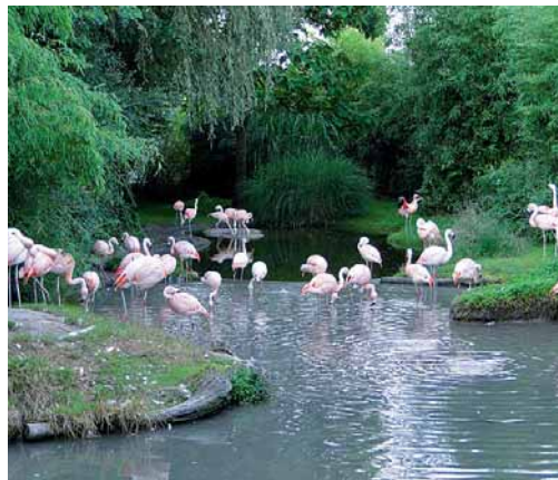
Die Columnni auf den Spuren der tierischen Kommunikation