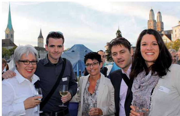
Columni Executive stossen auf das fünfjährige Jubiläum an.