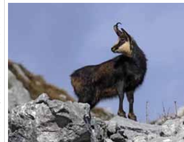
Einzigartiger Lehrgang: Vertiefte Kenntnisse über wildlebende Säugetiere erwerben