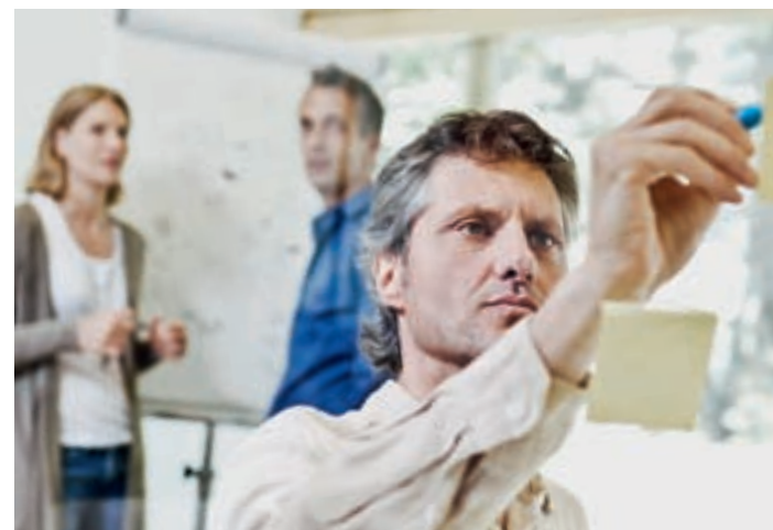
Die Teilnehmenden schätzen die kollegiale Beratung.

Was bedeutet Management in sozialen Organisationen? Mit dieser Frage sind viele im sozialen Bereich Tätige konfrontiert, wenn sie einen Karriereschritt machen und in neue Kompetenzfelder gelangen. Das Departement Soziale Arbeit bietet darum ihren Absolventinnen und Absolventen auf das Berufsumfeld abgestimmte Management-Weiterbildungen an. Dazu gehört auch der CAS Organisationen verstehen und entwickeln.