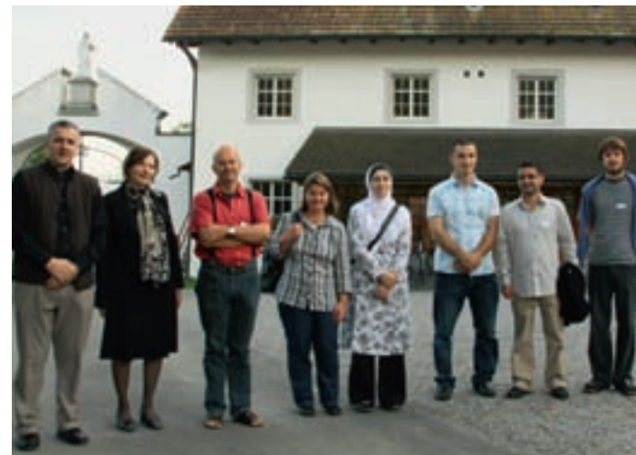
Teilnehmende und Leiterin des CAS Religiöse Begleitung in der Kartause Ittingen

Erfolgreiche Kommunikation und gegenseitiges Verständnis sind Voraussetzungen für das friedliche Zusammenleben von Menschen verschiedener Glaubensrichtungen und Sprachen. Der CAS Religiöse Begleitung im interkulturellen Kontext vermittelt wissenschaftlich fundierte Einblicke in die wichtigsten heute in der Schweiz präsenten Glaubensbekenntnisse. Er schärft den Blick für Problemfelder der interkulturellen Kommunikation und vermittelt handlungsorientierte Ansätze, um Konfliktpotenzial früh zu erkennen und eine Brücke zwischen religiösem und säkularem gesellschaftlichem Umfeld zu schlagen. Der Lehrgang wird von der Arbeitsstelle Interkulturelle Kompetenz des ISBB Institut für Sprache in Be-