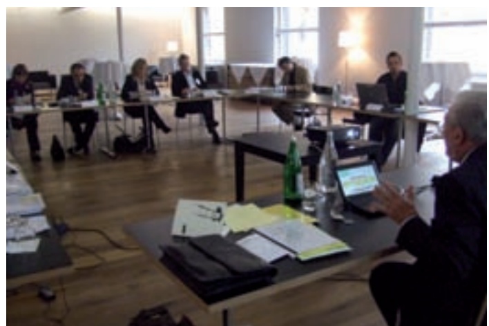
Blick in den LinQua-Workshop

det, die Qualität von Übersetzungsdienstleistungen auf einen klar definierten, für den Kunden nachvollziehbaren und international anerkannten Qualitätsstandard anzuheben, den Übersetzerberuf und sein Ansehen zu fördern und die Aus- und Weiterbildung von Übersetzerinnen und Übersetzern aktiv zu unterstützen. Als Verbandsmitglieder sind jene Übersetzungsdienstleister willkommen, die sich verpflichten, ihre Agentur oder ihr Unternehmen innerhalb von drei Jahren entsprechend der Europäischen Norm EN 15038 zertifizieren zu lassen. Die EN 15038 war ursprünglich als DIN-Norm geschaffen und später in eine Europäische Norm überführt worden, die auch für die Schweiz gilt. Sie wurde kürzlich als Schweizer Norm SN 15038 in das Schwei-