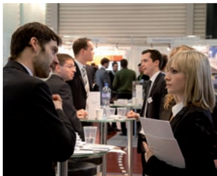
Studierende bereiten ihre Berufskarriere vor.

Am 17. März 2010 findet der Absolvententag der ZHAW zum 11. Mal statt. Dieser Anlass ist der ideale Treffpunkt für Studierende und Unternehmen. Rund 90 Unternehmen werden dieses Jahr in den Eulachhallen vertreten sein. Die Alumni ZHAW wird wieder mit einem Stand vor Ort sein, den sie in diesem Jahr in Zusammenarbeit mit Canon und EWZ betreibt.