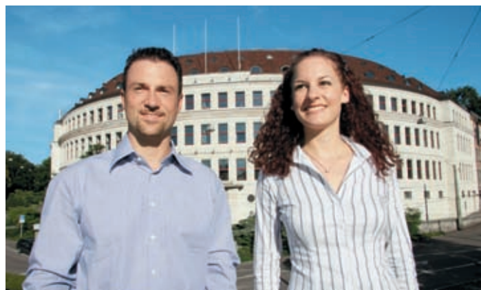
Fröhliche Gesichter auf dem Werbeplakat für die konsekutiven Masterstudiengänge