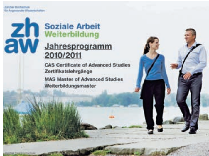
Das neue Weiterbildungs-Jahresprogramm 2010/2011