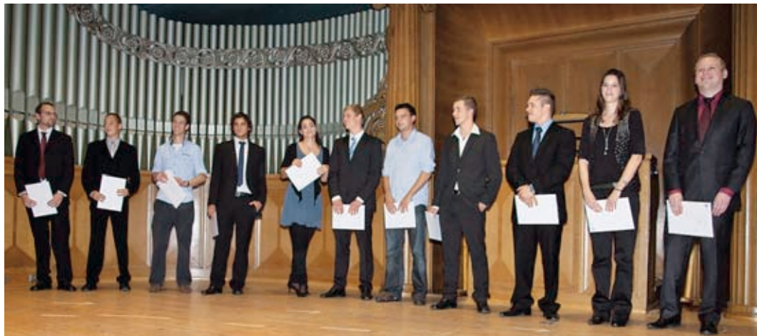
Frischgebackene Bachelor im reformierten Kirchgemeindehaus Winterthur

Am Freitag, 25. September 2009, feierten die Absolventinnen und Absolventen der Studiengänge Betriebsökonomie und Wirtschaftsrecht ihren Abschluss. Insgesamt haben an der School of Management and Law 273 Studierende ihr Studium erfolgreich abgeschlossen. Im Studiengang Betriebsökonomie mit den Vertiefungen Finanzökonomie, General Management, Wirtschaftsinformatik und International Management waren 218 Studierende (65 Frauen und 153 Männer) erfolgreich. Zum ersten Mal waren 19 Absolventinnen und Absolventen der Vertiefung International Management darunter. Das Studienprogramm International Management ist schweizweit einzigartig. Es wird vollständig in englischer Sprache angeboten und bereitet die