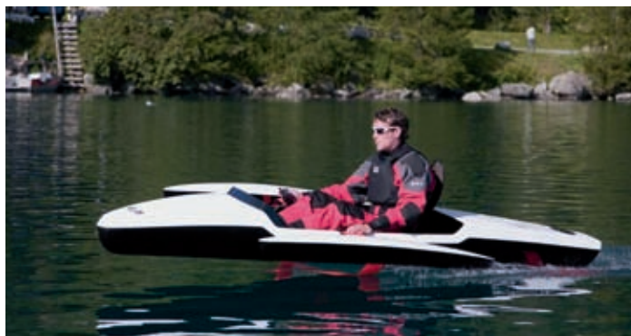
Das Boot auf Testfahrt

von über 20 Kilometern pro Stunde. Damit ist es gleich schnell wie die Kursschiffe auf dem Zürichsee.