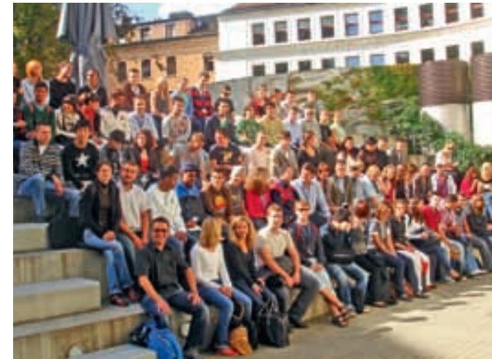
Die 77 Gaststudierenden aus 23 Ländern an der School of Management and Law

Die Zusammenarbeit mit guten Partneruniversitäten ist ein erklärtes Ziel der ZHAW School of Management and Law. Was eine gute Universität ist, entscheiden beispielsweise Hochschulrankings. Die Financial Times etwa listet für 2008 in ihrem «European Business School Ranking» die besten 65 Business Universities in Europa auf. Von diesen hat die School of Management and Law bereits sechs als Partner gewinnen können: Reims School of Management (Rang 26), ESC Toulouse (Rang 47), Warsaw School of Economics (57), ICN Nancy Business School