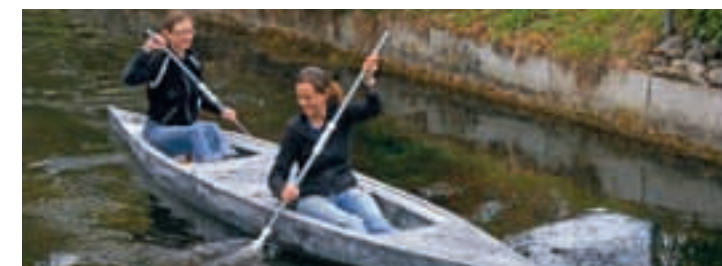
Die erste Testfahrt der «C-Pearl» verlief erfolgreich

Bauingenieurwesen und an der Entwicklung des Kanus «C-Pearl» beteiligt. Sie erproben Betonmischungen, entwickeln die Schalung und optimieren mittels 3D-Modellierung die Bootsform. Nicht zu vergessen sind Sponsorensuche, Materialbeschaffung, Finanz- und Ter-