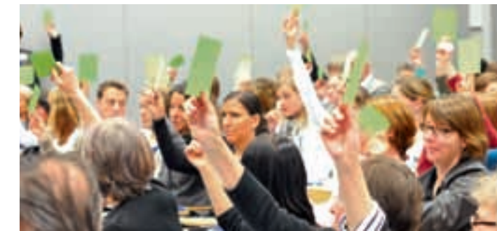
Die 74 Stimmberechtigten wählten den neuen Vorstand einstimmig.

Diesen Sommer werden am Departement Gesundheit die ersten Studierenden ihren Bachelorstudiengang abschli-