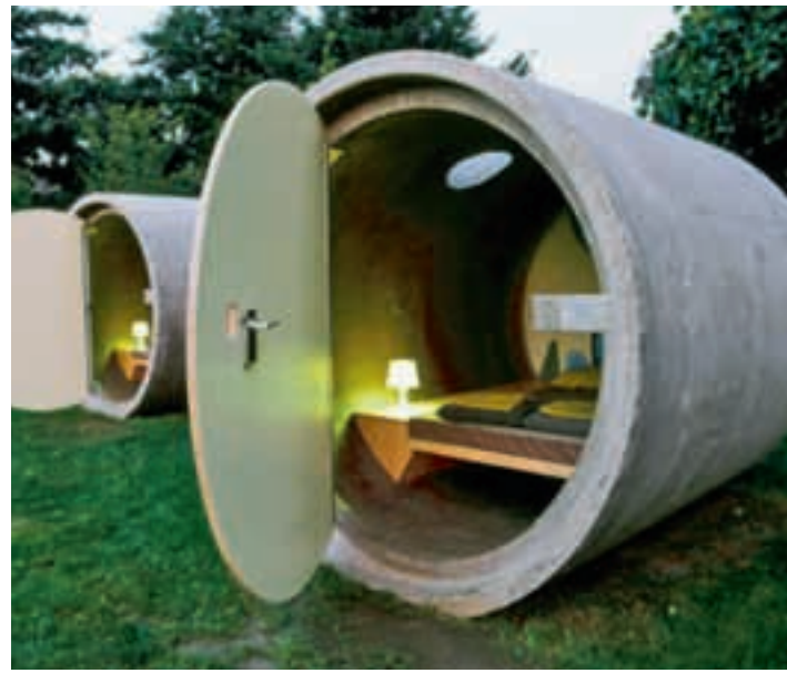
Clever aus der Röhre gucken: Neues Wohnen für Studies.

Zur Erlangung von bedürfnisgerechten und innovativen Ideen zum Thema studentisches Wohnen wird im Rahmen eines Sommerateliers ein intensiver Austausch mit mehreren interdisziplinären Arbeitsgruppen angestrebt, die sich aus Studie-