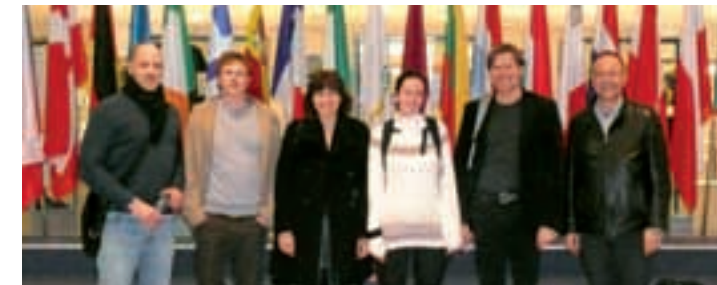
Die Delegation der ZHAW in Brüssel

Insgesamt nahmen an der Woche 120 Studierende und 20 Dozierende aus den Fachbereichen Soziale Arbeit und Human Resources teil. Für die