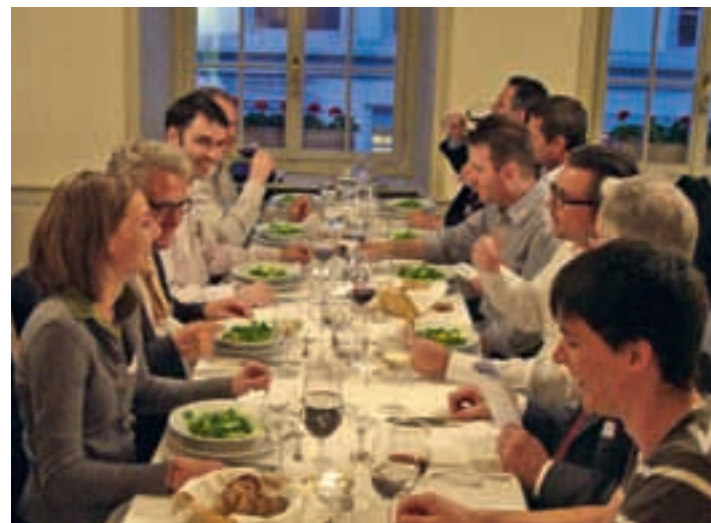
Beste Stimmung unter den Delegierten der ALUMNI ZHAW an der DV.