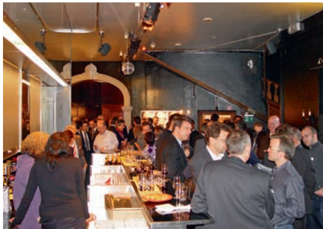
Austritt aus der FH Schweiz ja oder nein? Am Apéro der GV vom März 2009 wurde darüber intensiv diskutiert. Der Entscheid fällt nun am 16. Juni an einer a.o. GV.

Mittlerweile hat die Arbeitsgruppe mehrere Meetings durchgeführt und sowohl die Verantwortlichen der FH Schweiz zu Gesprächen getroffen wie auch die Argumente des Vorstands zur Kenntnis genommen. Die entscheidende a.o. GV findet nun am 16. Juni 2009 statt, an welcher die Arbeitsgruppe ihre Analyse präsentieren wird. Die Einladung zu dieser a.o. GV ist den Mitgliedern im Mai zugestellt worden,