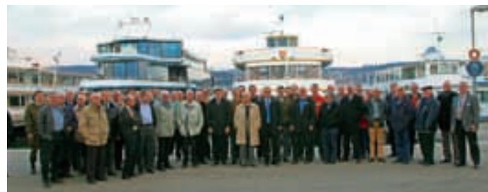
Bei Ingenieuren und Architekten beliebt: Die Schiffe der ZSG.

Die Zürichsee Schifffahrtsgesellschaft (ZSG) war Gastgeber der diesjährigen Mitgliederversammlung des Alumni-Vereins Engineering & Architecture. Nach einem kurzen Film über die ZSG, deren Gründung auf das Jahr 1834 zurückgeht, wurden die anwesenden Mitglieder von den Kapitänen durch die riesige Werkstatt geführt. Besonderen Anlauf fanden die Führungen durch die Maschinenräume eines der beiden alt-