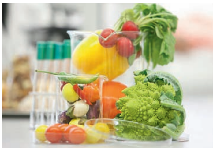
Gesündere Ernährung dank «nutrifuture».