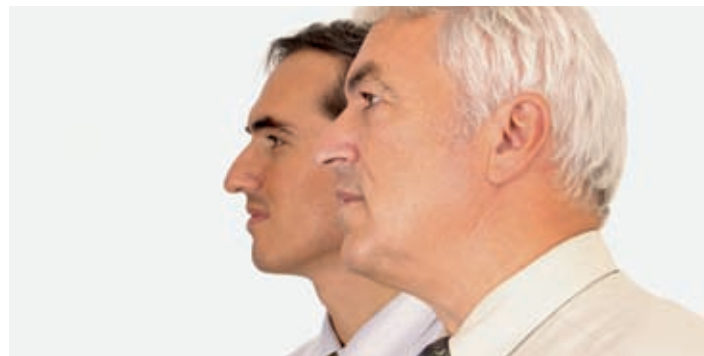
Eine gute Nachfolgeregelung nimmt beide Parteien in Anspruch.

ter Übergaben verloren gehen. Das KTI-Projekt «KMU-Nachfolge» nimmt sich dieser Problematik an und identifiziert mögliche Ursachen für das Scheitern einer Übergabe. Die Untersuchung, die sich auf nicht börsennotierte Familienunternehmen konzentriert, hält unter anderem folgende Erkenntnisse fest: Entscheidungs-