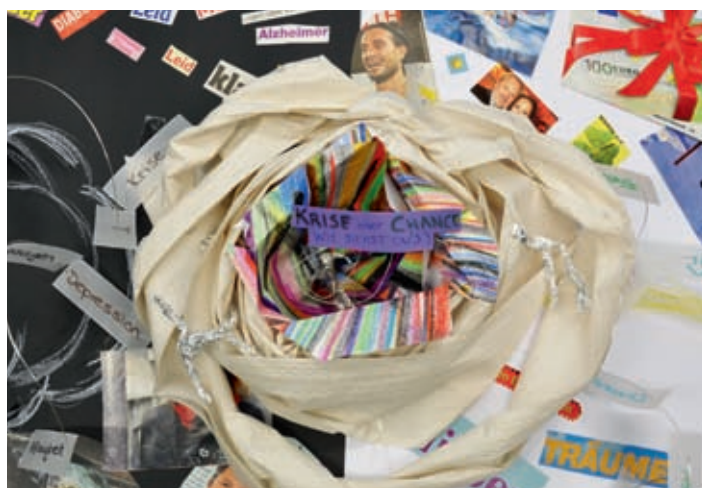
Teamarbeit zum Thema «Krise oder Chance?»