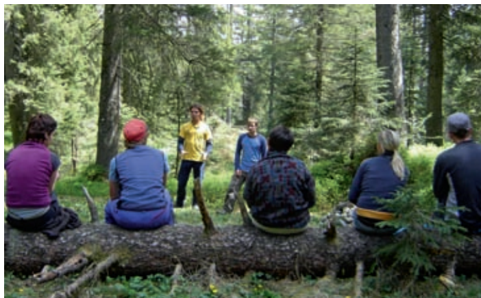
Der Wald erweist sich als idealer Lernort.