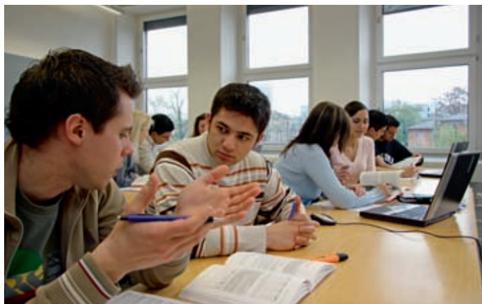
Studierende haben ab Herbst 2009 mehr Wahlmöglichkeiten.