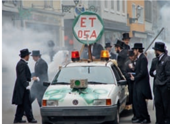
Ausgelassener Umzug zum Abschluss der Frackwoche.

Der Umzug bildet den Abschluss der Frackwoche, welche in der Regel nach der Diplomarbeit zelebriert wird. In der Frackwoche tragen die Herren Frack und einen Bart, den sich die Studenten wachsen liessen und erst nach dem Frackumzug weg-rasieren. Die Damen tragen ent-