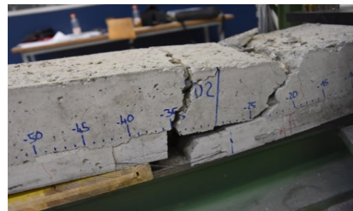
Bruchbild eines Probekörpers mit einer verzahnten Fuge (Versagen der Zugbewehrung)