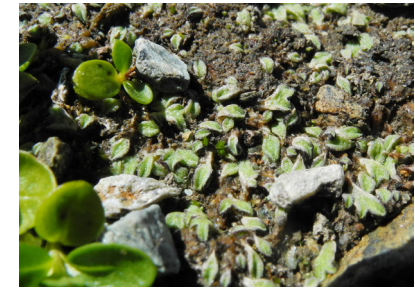
Abb. 4. Thalli von Riccia breidleri auf dem ausgetrockneten Seegrund auf 2856 m ü. M. (Foto: Ariel Bergamini).

Bardat & Geissler 2000, Köckinger 2017). An beiden Fundorten wuchs die Art am Grunde ausgetrockneter Schmelzwasserseen und bildete grosse Populationen, die sich am tiefer gelegenen Fundort über ca. 150 m 2 ausdehnten, am oberen Fundort über 20-30 m 2 (Abb. 3, 4).