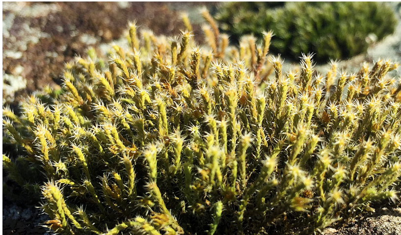
Abb. 1. Hedwigia stellata auf einem grossen granitischen Findling bei Aubonne (VD). Gut zu erkennen sind die charakteristisch abspiezierenden hyalinen Blattspitzen, die der Art den namensgebenden sternartigen Aspekt geben.

Jura zu liegen. Dort ist H. stellata auf silikatische Findlinge angewiesen, die auch für zahlreiche weitere bemerkenswerte Moosarten schützenswerte Lebensrauminseln sind (Melyan 1912, Hepenstrick et al. 2016).