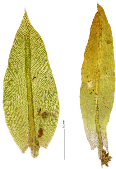
Abb. 5. Die Blätter von Zygodon conoideus (links) sind deutlich breiter als die Blätter von Z. dentatus (rechts; Foto: A. Büschlen).