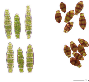
Abb. 6. Anhand der Brutkörper lassen sich Zygodon conoideus (links) und Z. dentatus gut unterscheiden (rechts; Foto: A. Büschlen).

Hinter dem Schützenhaus Obfelden/Maschwanden führt die Gemeindegrenze vor dem Schnitzzellagerplatz quer durch einen artenreichen Mischwald mit Weisstanne, Rottanne, vereinzelt Lärchen, Föhre, Esche, Rotbuche, Hagebuche und Eiche. An mehreren Rotbuchen mit Stammdurchmessern von 20 - 30 cm konnten dort immer wieder kleine Polster von Z. conoideus gefunden werden. Hier in Gesellschaft mit Z. dentatus , Cryphaea heteromalla , Orthotrichum spp., Ulota spp., Metzgeria furcata , Frullania dilatata und Radula complanata .