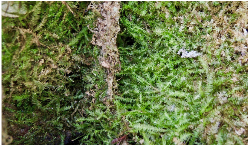
Abb. 2. Plagiothecium neckeroideum am Standort in einer Felshöhlung (Foto: Norbert Schnyder).

gilt. Wenige ältere Funde aus der Schweiz sind bekannt aus den Kantonen Bern, Uri und Graubünden (Swissbryophytes Working Group 2019b). Diese Funde liegen alle über hundert Jahre zurück und es ist vorgesehen, einige von diesen für die aktuelle Überarbeitung der Roten Liste der Moose der Schweiz (Bergamini et al. 2016) nachzusehen. Die Art ist keine auffällige Erscheinung (Abb. 2) und es ist gut möglich, dass bei gezielter Suche noch einige weitere Funde in schattigen, montanen bis subalpinen Wäldern mit silikatischen Blöcken oder Felspartien gemacht werden können.