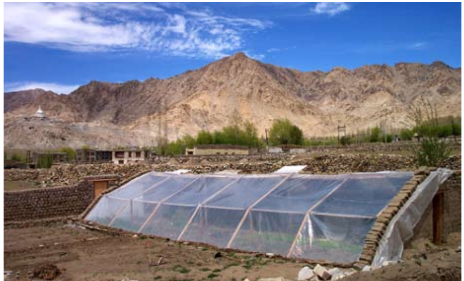
Zusätzliche Einnahmequellen für die Bevölkerung durch lokalen Gemüseanbau in Treibhäusern

Das Projekt verfolgt einen ganzheitlichen Ansatz. Ziel ist es, der ländlichen Bevölkerung die Möglichkeit zu geben, die Vegetationsperiode zu verlängern, Einkommen durch den Verkauf von Gemüse auf dem Markt zu generieren und