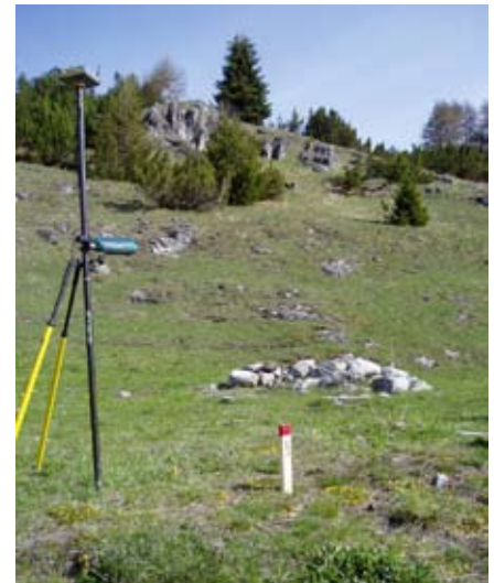
Die Linienführung wird im Bereich der Trockenstandorte mit der Umweltbaubegleitung optimiert

••• Auszäunen von speziellen Florastandorten mit Ährigem Erdbeerspinat, Nordischem Mannsschild etc., Entfernen von störenden Steinen und Bildung von neuen Steininseln als Lebensraum für Insekten und Reptilien, Festlegen der Zufahrtswege für Baumaschinen unter Umfahrung von Trockenstandorten wie Blaugrashalden, Kalkfelsgrusflur des Gebirges etc. sowie Erosionsschutz mittels Palisaden in steileren Gebieten. Solche Massnahmen wurden vor Ort mit Bauleitung, Bergbahnen und Bauunternehmern besprochen und im Gelände markiert.