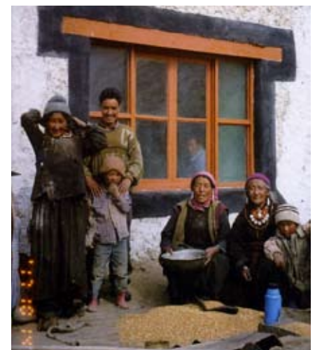
Familie in Ladakh

By Kathrin Dellantonio Stiftung myclimate Technoparkstrasse 1 / 8005 Zürich +41 (0)44 633 77 50 kathrin.dellantonio@myclimate.org