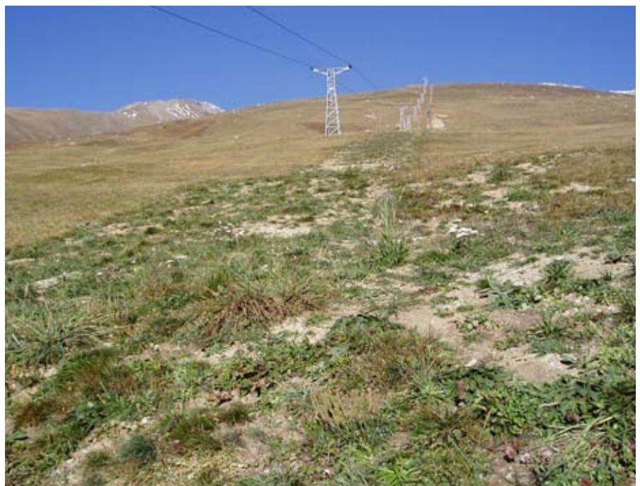
Mit standortgerechtem Saatgut begrünter Graben nach einer Vegetationsperiode

••• Für unvermeidbare Eingriffe in schützenswerte Vegetation muss gemäss Natur- und Heimatschutzgesetz Ersatz geleistet werden. Ein Vorschlag wird in Absprache mit dem Amt für Natur und Umwelt sowie Pro Natura ausgearbeitet. So sollen beispielsweise Trockenstandorte durch eine angepasste Bewirtschaftung vor