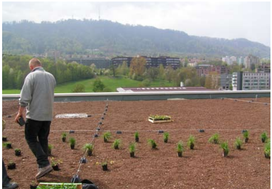
Eine der zwei Arbeitsflächen mit den Kapellen im Hintergrund

Grundsätzlich stehen für gärtnerische Kultivierungs- und Vermehrungsmassnahmen gene-