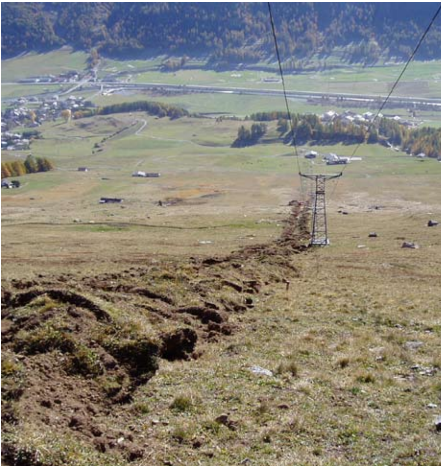
Graben für Beschneigungsleitung mit separiertem Oberboden und Rasenziegeln

dem Einwachsen durch Legföhren bewahrt werden. Trockenmauern werden als ideale Lebensräume für Reptilien wieder in Stand gesetzt.